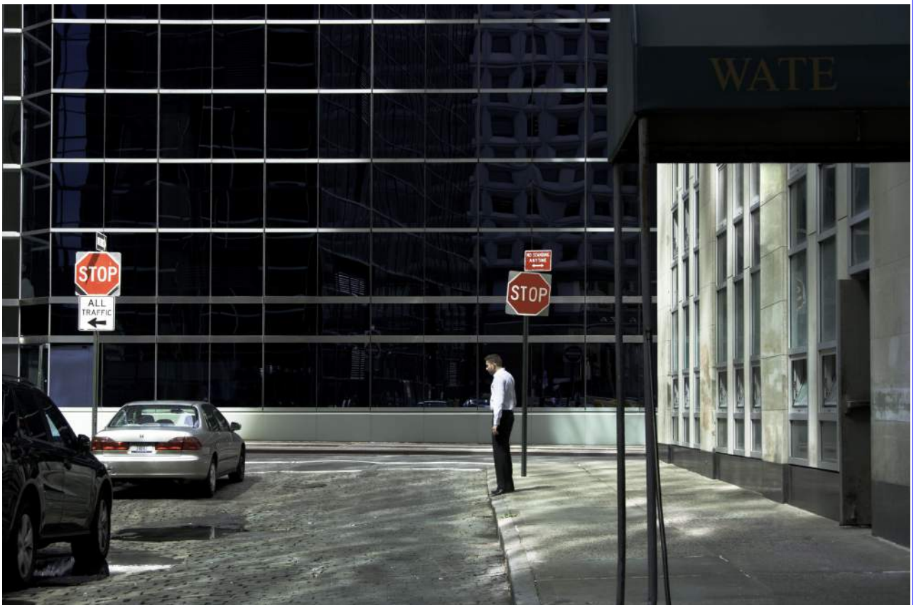
No name city. Somewhere 9 (100x70)