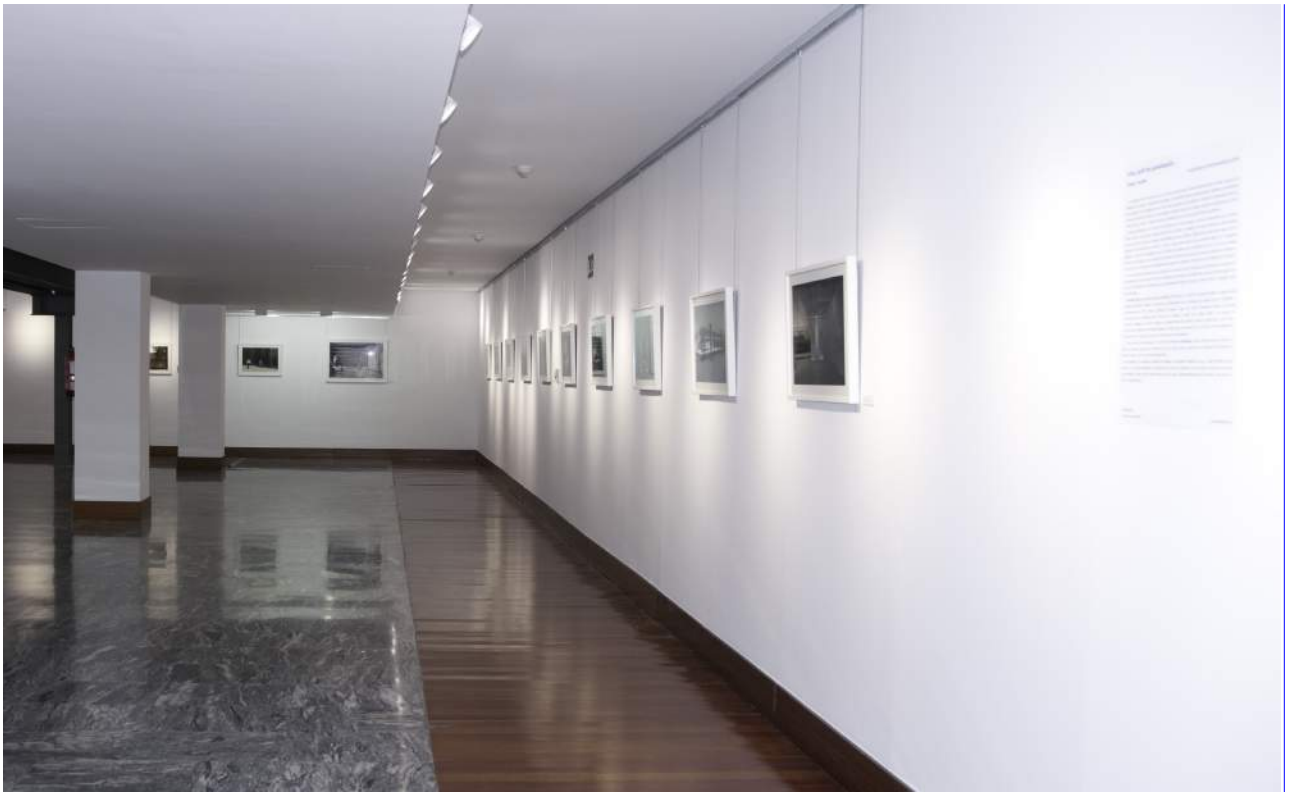
Vista de la exposición