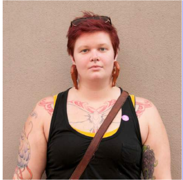
101 Faces in Manhattan. (40x40)