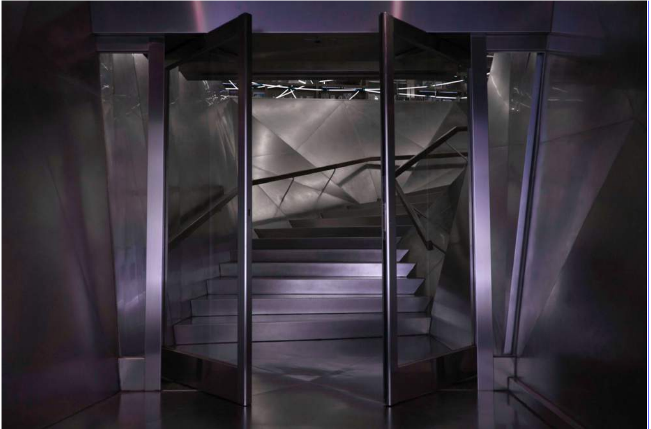
Adyton. Espacio III (50x70)