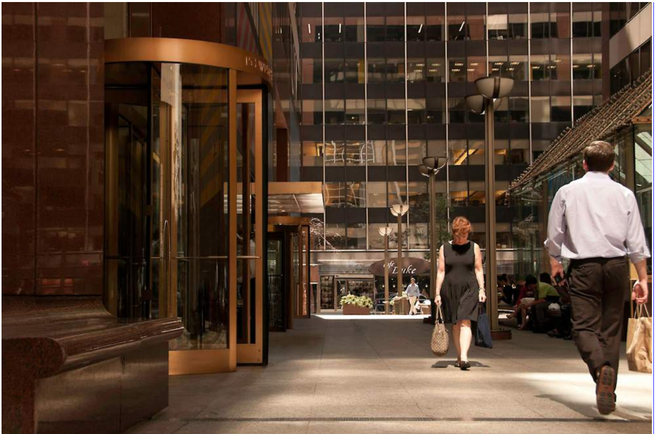
No name city. Somewhere 8 (50x70)