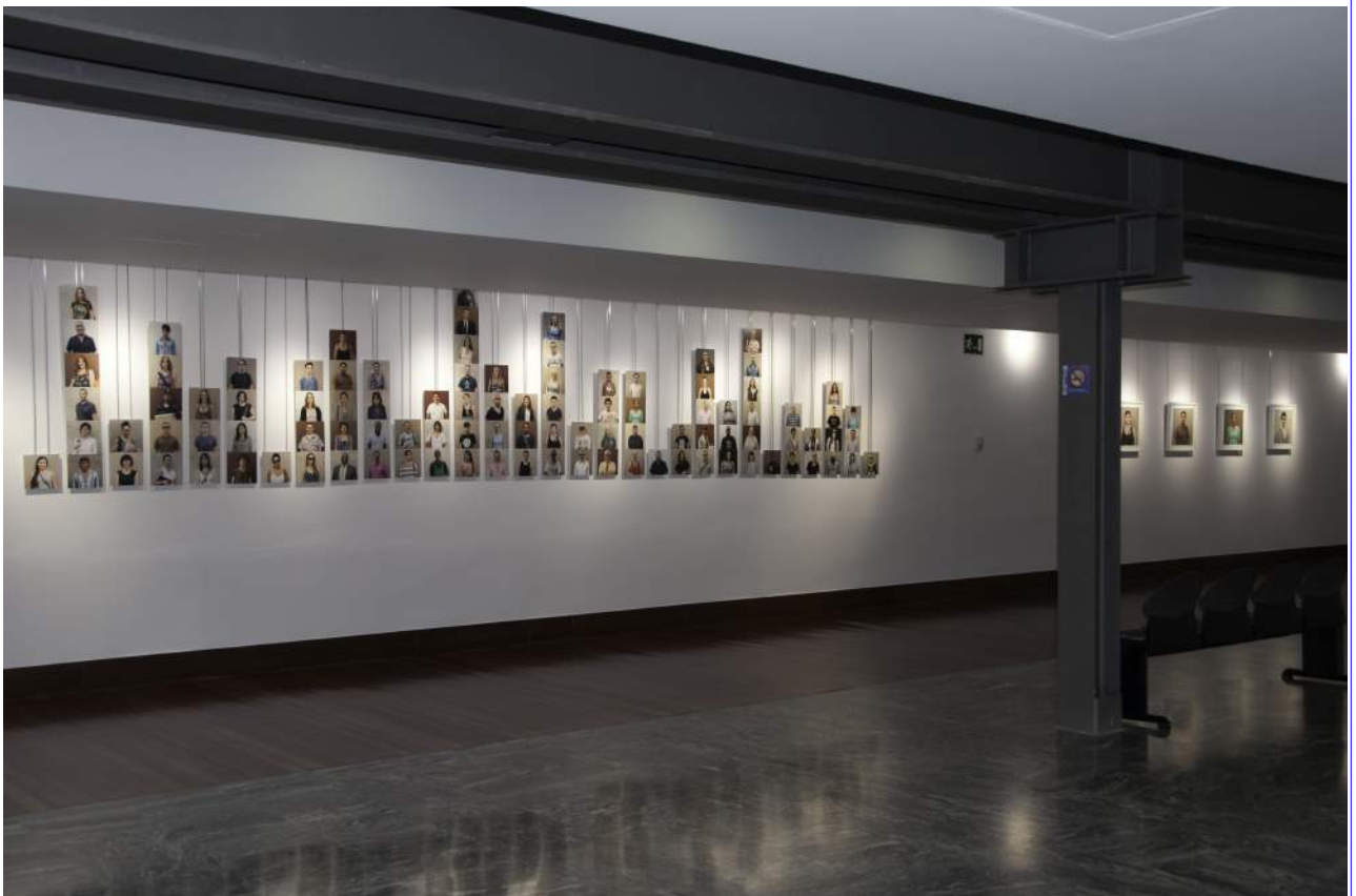
Vista de la exposición