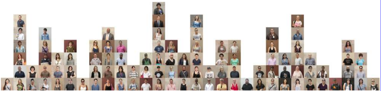
Skyline 101 Faces in Manhattan. (6 m x 1,40 m)

Una exposición compuesta por tres trabajos fotográficos de César Lacalle: No Name City, Adyton y 101 Faces in Manhattan, un recorrido formado por 16 fotografías y un gran montaje de 6 metros de longitud compuesto por los 101 retratos de Manhattan.